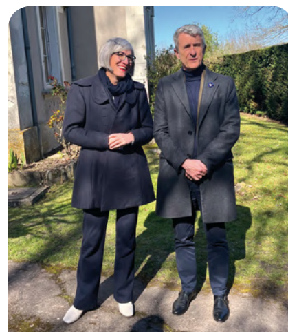
Madame la directrice de l'agence de santé Centre-Val-de-Loire et le Monsieur le préfet d'Indre et Loire.

Nous présentions également nos projets d'avenir pour notre établissement, ainsi que les besoins en financement, dans le cadre du plan de rénovation de notre établissement. Si le sérieux