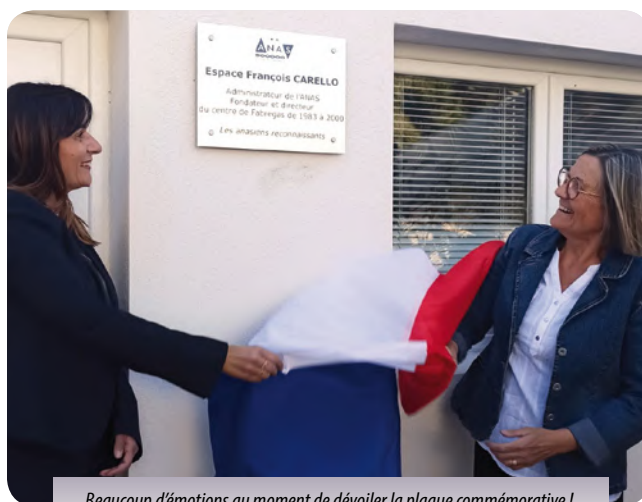
Beaucoup d'émotions au moment de dévoiler la plaque commémorative !

Cette cérémonie était l'occasion d'évoquer la carrière et l'ac-